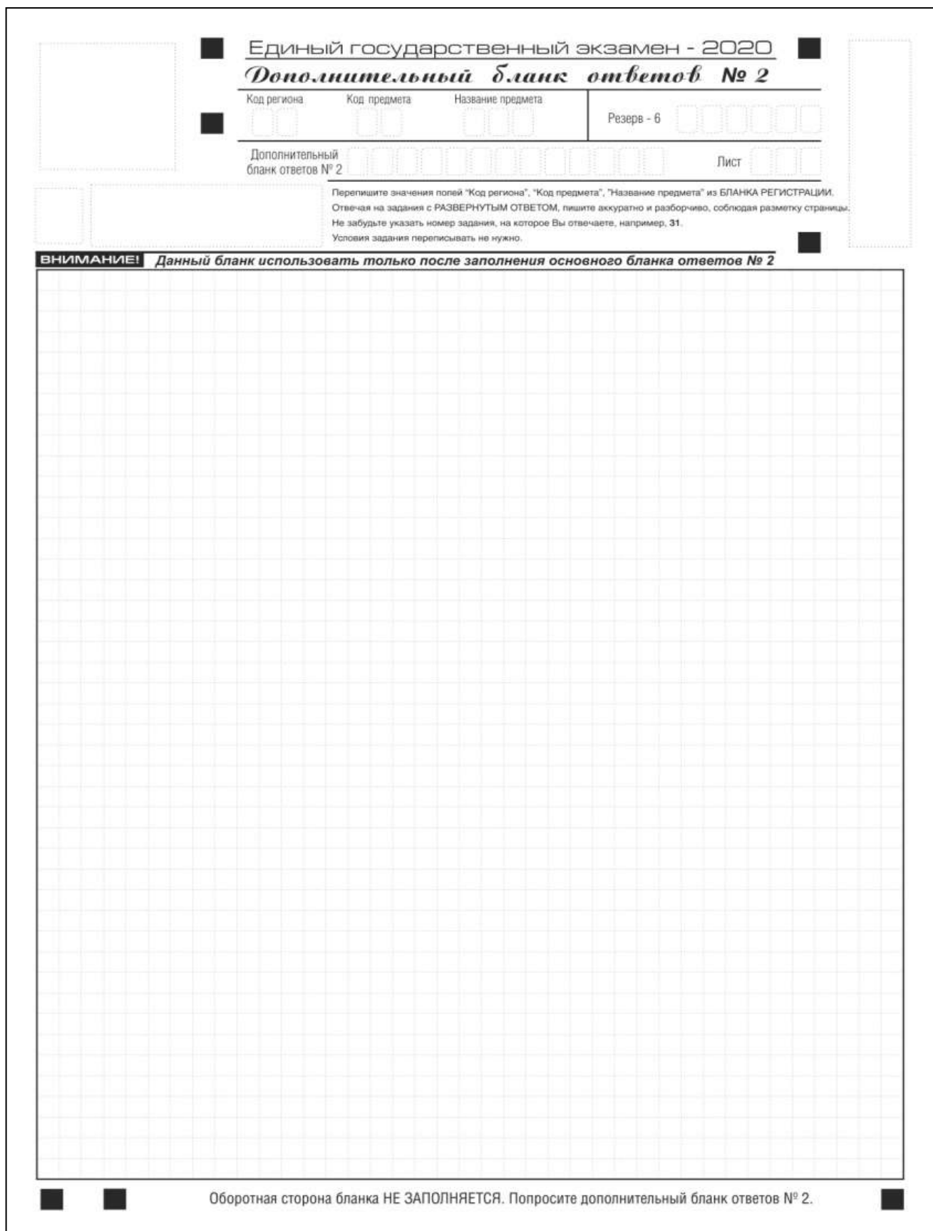
Рис. 15. Дополнительный бланк ответов № 2